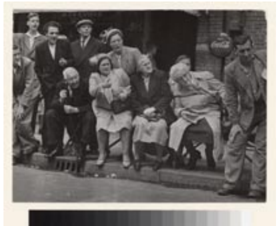
Sem Presser, Bevrijdingswielervedstrijd Jordaan, 1945