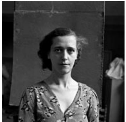
Ad Windig, Nicht Bertus Sondaar z.j., jaartal onbekend © Ad Windig/MAI