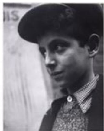
Wolf Suschitzky, Portret van een joods jongetje, 1934 - 1935