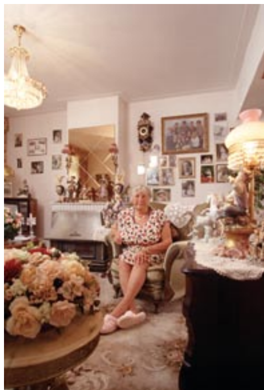
Paul Huf, Tante Stijn, Jordaan, Amsterdam, 1997