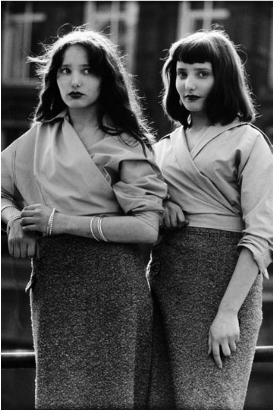
Ed van der Elsken, Tweeling op de Nieuwmarkt, Amsterdam, 1956 © Ed van der Elsken/Nederlands Fotomuseum, courtesy Annet Gelink Gallery