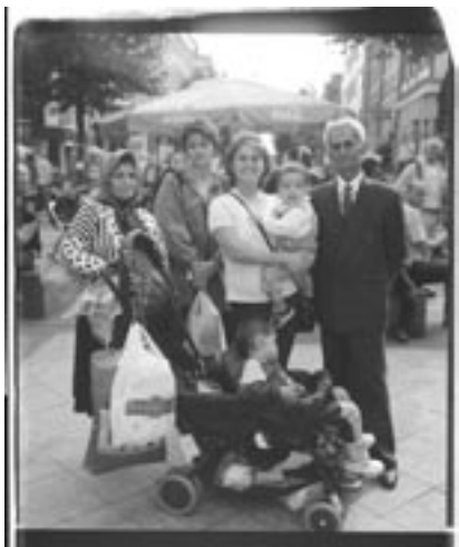
Ulay, Gezin met wandelwagen op de Albert Cuijp (uit de serie 'Polaroid Portraits'), 2000 © Ulay/Stadsarchief Amsterdam