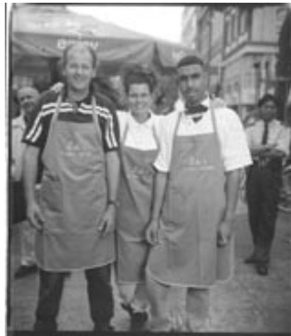
Ulay, Drie medewerkers van Bob's Vlaamse frites op de Albert Cuijp (uit de serie 'Polaroid Portraits'), 2000

In september 2000 huurde kunstenaar Ulay een kraam op de Albert Cuijpmarkt. Met een grote polaroidcamera voor 20 x 24 inch foto's portretteerde hij bezoekers van de markt. In 3 dagen maakte hij zo een serie van 50 zwart-wit foto's die met elkaar een prachtig document vormen voor de culturele en etnische diversiteit van Amsterdam.