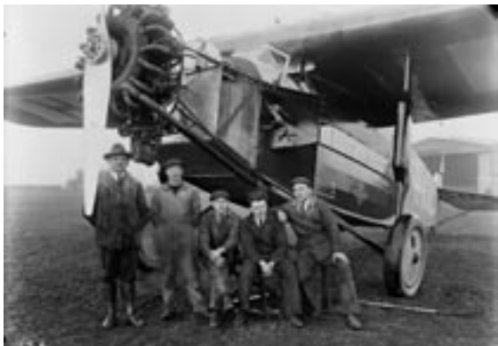
Onbekend, Fokker F.VIIa, H-NACT, vliegveld Waalhaven, tweede helft jaren twintig