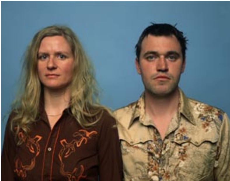
Marnix Goossens, Cowboy Couple, 2000

Henk Wildschut en Raimond Wouda hebben in opdracht van het Stadsarchief Amsterdam het Amsterdamse havengebied vastgelegd. Wildschut richtte zich op het portretten van werknemers in de Amsterdamse haven, terwijl Wouda voornamelijk het (industriële) landschap fotografeerde. De totale serie maakt deel uit van de collectie van het Stadsarchief.