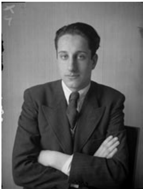
Sem Presser, Zelfportret, ca. 1935

In september 2000 huurde kunstenaar Ulay een kraam op de Albert Cuijpmarkt. Met een grote polaroidcamera voor 20 x 24 inch foto's portretteerde hij bezoekers van de markt. In 3 dagen maakte hij zo een serie van 50 zwart-wit foto's die met elkaar een prachtig document vormen voor de culturele en etnische diversiteit van Amsterdam.