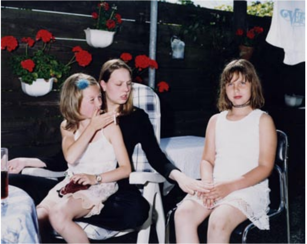
Raimond Wouda, Pearl, Vienne en Kimberley (uit de serie: 'Tuindorp Oostzaan'), 1999