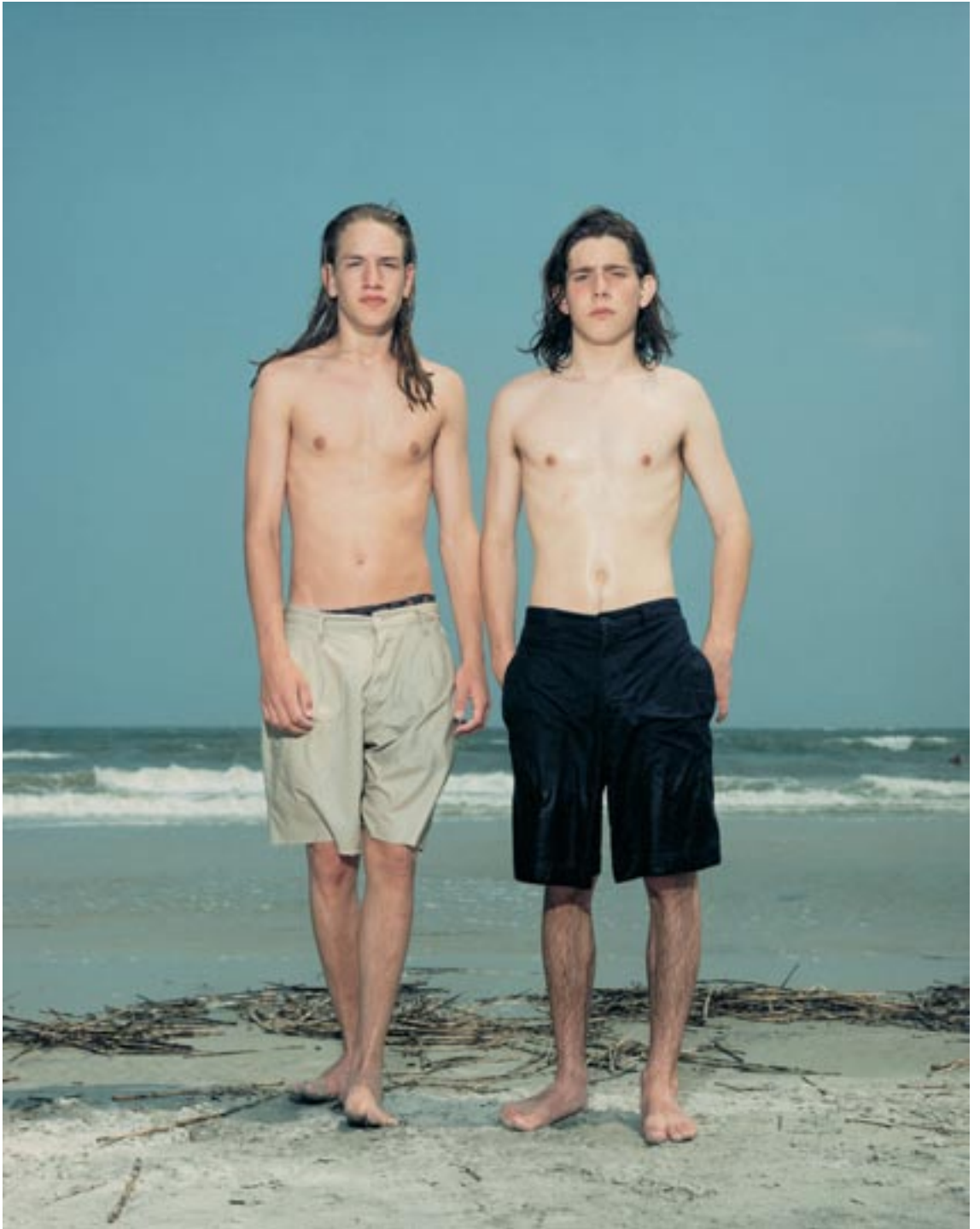
Rineke Dijkstra, Hilton Head Island, SC, USA, 27 June 1992