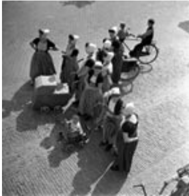
Eva Besnyö, Vrouwen in klederdracht met kinderwagens, Middelburg, 1939 © Eva Besnyö/MAI