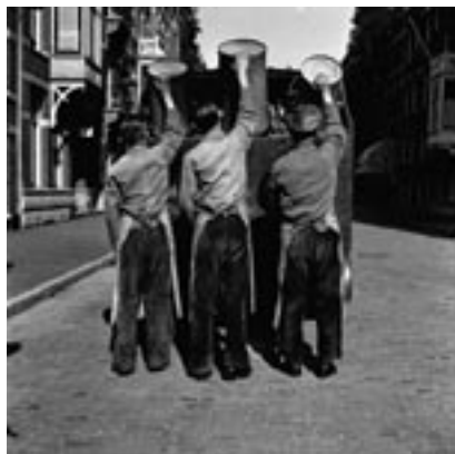
Eva Besnyö, Vuilnismannen, Amsterdam, jaren vijftig © Eva Besnyö/MAI

venarchief van de KLM omvat circa tienduizend opnamen. Een bedrijfsfotoarchief van glasnegatieven op dit formaat uit deze periode is zeldzaam. De tijdsperiode van de foto's omvat de beginjaren van de KLM tot aan de Tweede Wereldoorlog. Daarna werden de gebeurtenissen met een vlakfilmcamera vastgelegd en verdween de glasplatencamera naar de studio voor reproductiefotografie.