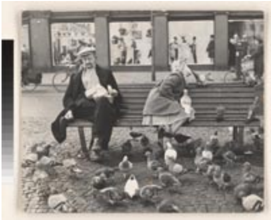
Dolf Toussaint, Mensen voeren duiven op een bankje op de Dam, Amsterdam, ca. 1965