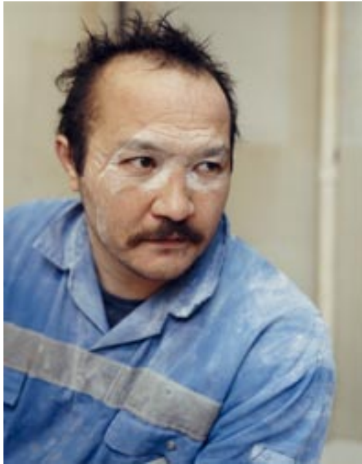
Henk Wildschut, AMFERT: René Hupkes (Uit de serie 'A'dam Dock'), 2004

Henk Wildschut en Raimond Wouda hebben in opdracht van het Stadsarchief Amsterdam het Amsterdamse havengebied vastgelegd. Wildschut richtte zich op het portretten van werknemers in de Amsterdamse haven, terwijl Wouda voornamelijk het (industriële) landschap fotografeerde. De totale serie maakt deel uit van de collectie van het Stadsarchief.