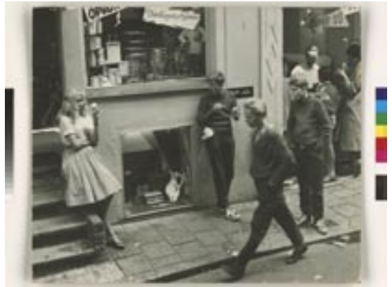
Dolf Toussaint, De ijscowinkel in de Voetboogstraat in Amsterdam, ca. 1963 © Dolf Toussaint/Rijksmuseum Amsterdam