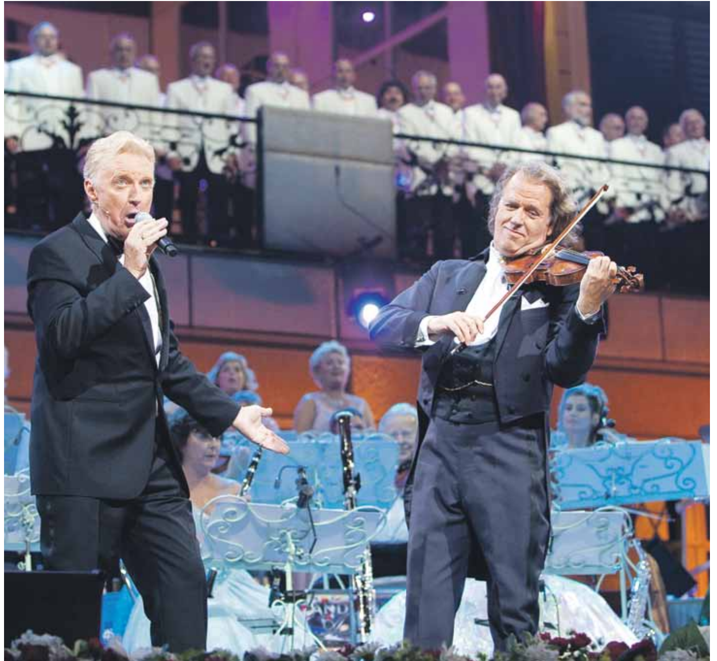
André Rieu Productions BV

Vooral komen! En meedansen en -zingen voor het nieuwe koningspaar. Het wordt een uniek feest.