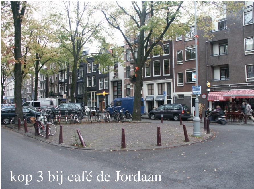
kop 3 bij café de Jordaan