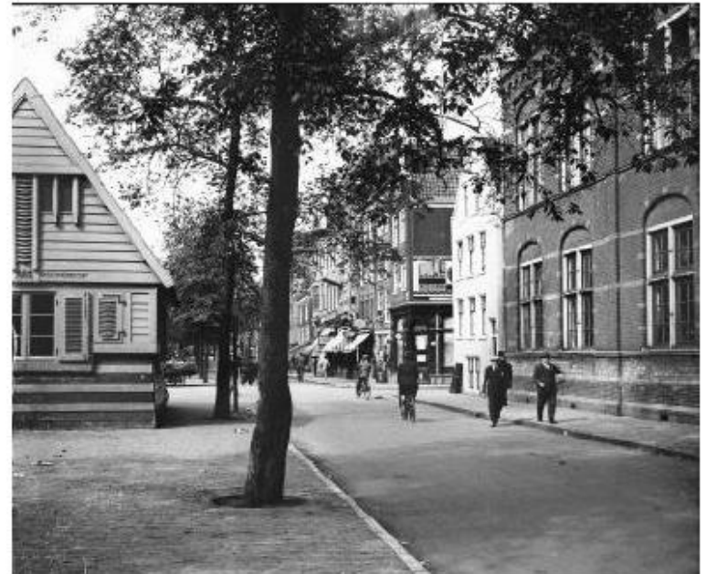
Situatie 1930/ 1950 inspiatiebron voor de herinrichting anno nu 11