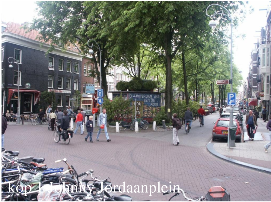
kop 1 Johnny Jorjaanplein