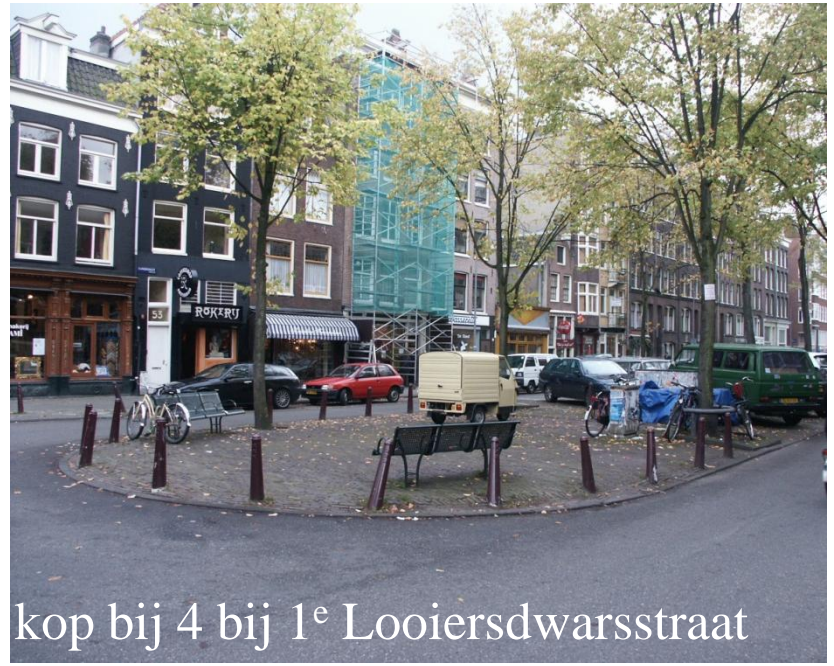
kop bij 4 bij 1 e Looiersdwarstraat