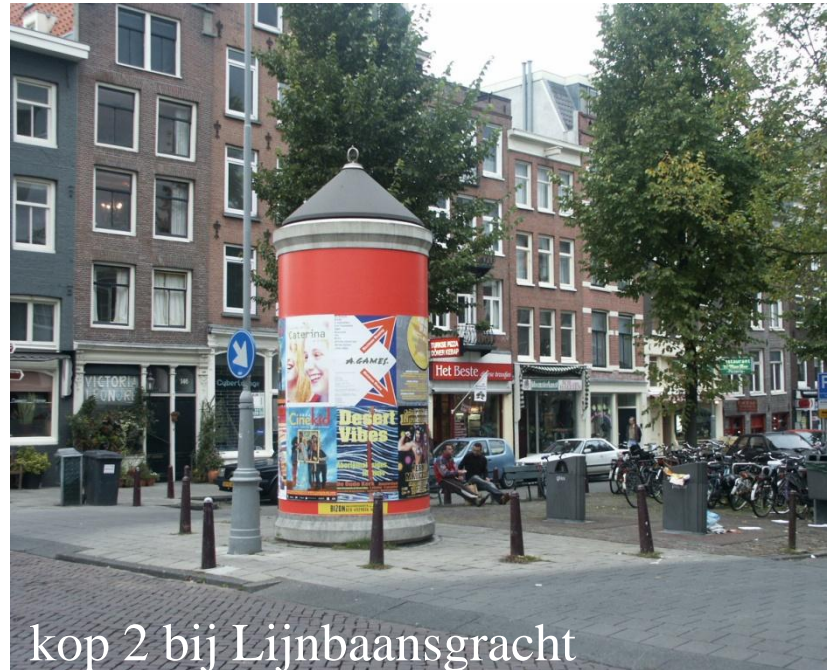
kop 2 bij Lijnbaansgracht